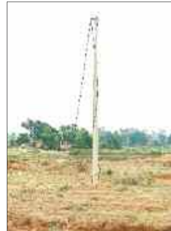
आज तक अधिकारियों द्वारा आमजन की उक्त गंभीर समस्या की ओर ध्यान नहीं दिया जा रहा है। उक्त मोहल्ले में दो महीने से विद्युत आपूर्ति बाधित रहने से लोगों को जहां एक ओर कृषि कार्य हेतु प्रभावित होना पड़ रहा है वहीं दूसरी ओर बच्चों की पढ़ाई भी पूरी तरह प्रभावित हो रही है।

सीमा विवाद का दंश पिछले दो महीने से ग्राम पंचायत कुम्दाबस्ती के डोढगापारा के लोगों को दिवरी युग में जीवन यापन करके भुगतना पड़ रहा है। सूरजपुर व विश्रामपुर विद्युत वितरण केंद्र के अधिकारियों द्वारा एक दूसरे को जिम्मेदार बताकर चोरी गए विद्युत केबल की बजाय अब ईकेबल नहीं बिछाए जाने से विद्युत आपूर्ति दो महीने से गांव में बंद पड़ी हुई है, गांव में अंधेरे की वजह से आमजन को खासी परेशानी का सामना करने विवश होना पड़ रहा है। गौरतलब है कि ग्राम पंचायत कुम्दाबस्ती के डोढगापारा में करीब दो महीने पूर्व अज्ञात चोरों द्वारा करीब सौ मीटर विद्युत केबल की चोरी कर लिया गया है। जिस वजह से गांव के करीब 15-20 घरों के लोगों को दिवरी युग में जीवन यापन करने विवश होना पड़ रहा है। ग्रामीणों ने बताया कि उक्त गंभीर समस्या की ओर कई बार विभागीय अधिकारियों को अवगत कराया गया, बावजूद इसके