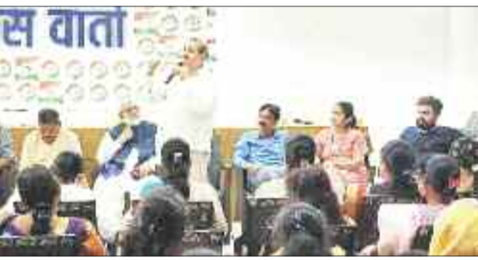
बैठक को संबोधित करते एमआईसी सदस्य।